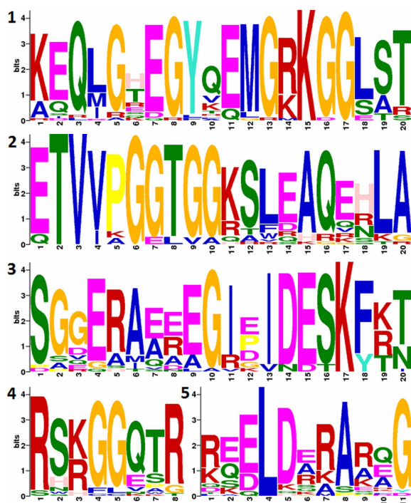
Hình 2. Các motif bảo thủ được tìm thấy trong các trình tự protein LEA5 được phát hiện nhờ chương trình MEME [3].