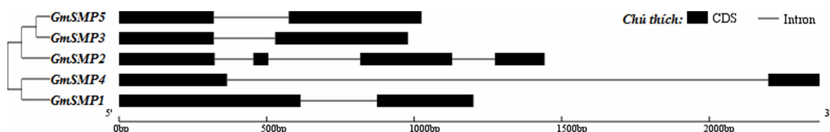
Hình 3. Cấu trúc exon/intron của các SMP của cây đậu tương (CDS: trình tự mã hóa protein, intron: trình tự không mã hóa protein)